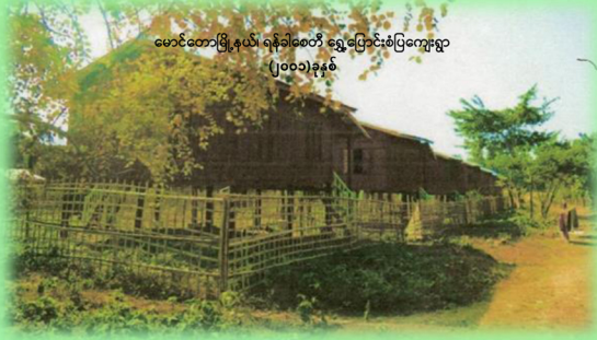
မောင်တောမြို့နယ်၊ ရန်ခါစေတီ ရွှေပြောင်းစံပြကျေးရွာ (၂၀၀၁)ခုနှစ်