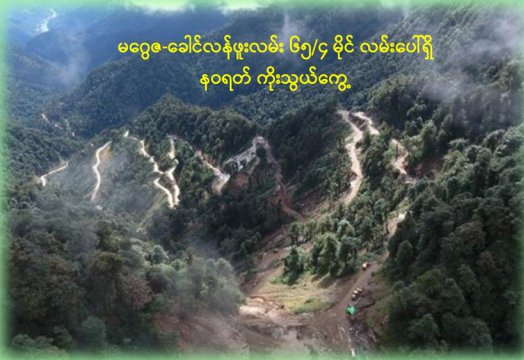
မဂ္ဂဇ-ခေါင်လန်ဖူးလမ်း ၆၅/၄ မိုင် လမ်းပေါ်ရှိ နဝရတ် ကိုးသွယ်ကျွေ

"နယ်စပ်ဒေသတွင် လူမှုစီးပွားဘဝအခြေခံအဆောက်အအုံများ အမြန် ဖွံ့ဖြိုးတိုးတက်စေရမည်"