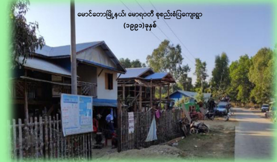
မောင်တောမြို့နယ်၊ မောရဝတီ စုစည်းစံပြကျေးရွာ (၁၉၉၁)ခုနှစ်

ဒေသခံများအား စုစည်းနေရာချထားခြင်းဖြစ်ရာ ဒေသ၏ ရေ၊ မြေ၊ တောတောင်သာတ၊ အသက်မွေးဝမ်းကျောင်း၊ လေ့ထုံးစံများနှင့် ကိုက်ညီမှုရှိသဖြင့် အောင်မြင်ခဲ့ပါသည်။