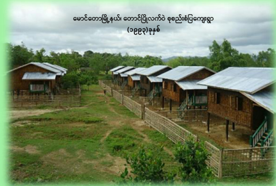
မောင်တောမြို့နယ်၊ တောင်ပြုလက်ဝဲ စုစည်းစံပြကျေးရွာ (၁၉၉၃)ခုနှစ်